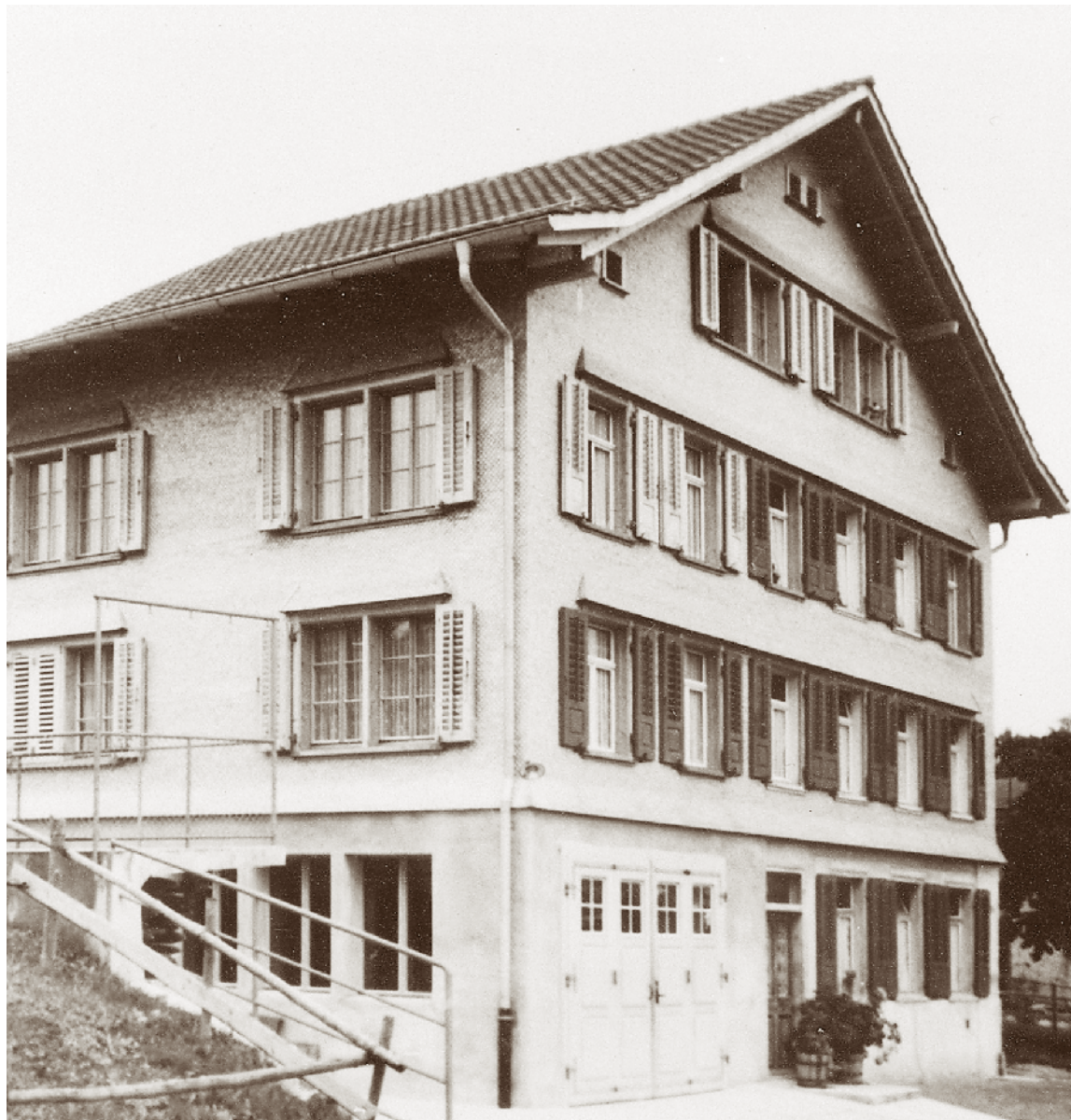
Schwellbrunner- strasse 40 im Jahr 1953.