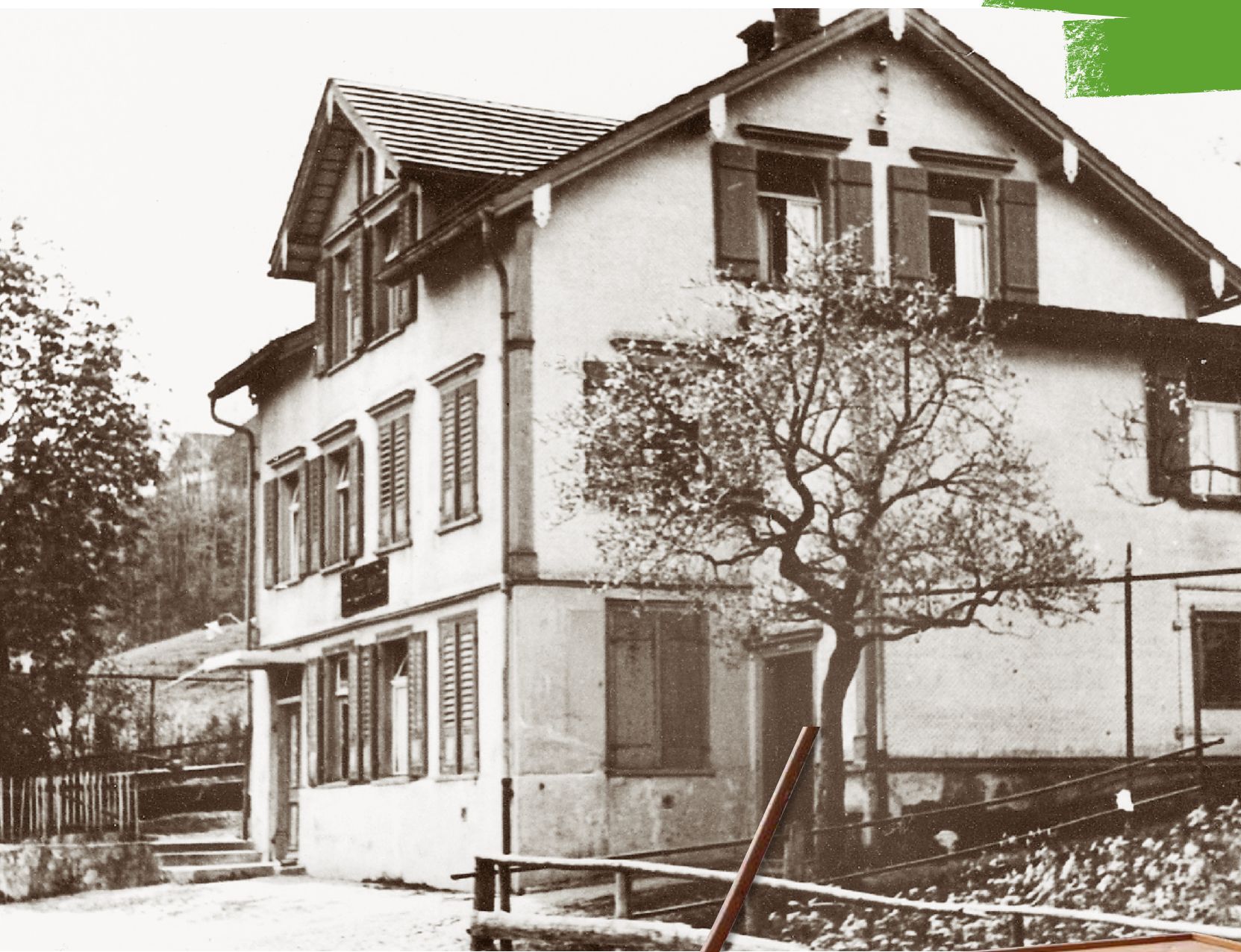
Start der Firma Alder an der Schwellbrunnerstrasse 40 im Jahr 1924.